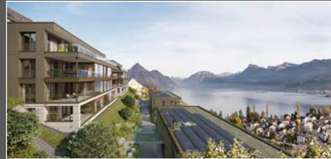
Oberhalten Ennetbürgen NW / 64 Wohneinheiten