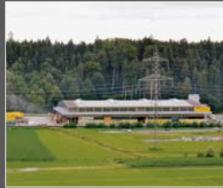
Produktionszentrum in Root LU