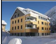
Gründung der Strüby Immo AG, erste Arealüberbauungen