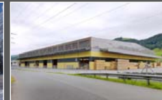
Bau des Produktionszentrums in Root LU