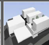
Gründung Strüby Konzept AG + Einstieg in die Architektur und Planung