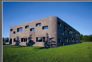
STR Engineering GmbH in Augsburg D

Architektur & Holzbau als Gesamtleistung Strüby Konzept AG | Strüby Holzbau AG | Strüby Immo AG