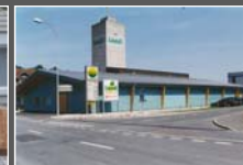
Bau der ersten LANDI