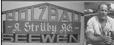
Gründung der Strüby Holzbau AG