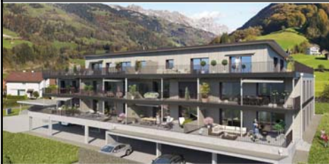
Walsermätteli Bürglen UR / 10 Wohneinheiten