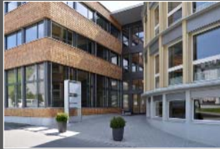
Hauptsitz in Seewen SZ