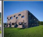
Gründung der STR Engineering GmbH in Augsburg D