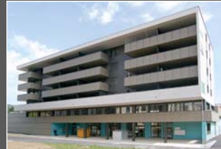
Zweigstelle in Bulle FR