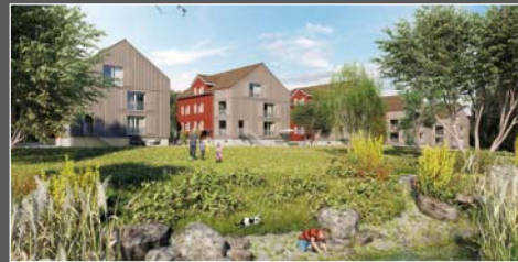
Lorzenweid Hagendorn ZG / 16 Wohneinheiten

Architektur & Holzbau als Gesamtleistung Strüby Konzept AG | Strüby Holzbau AG | Strüby Immo AG