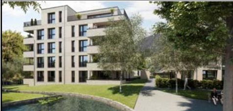
Am Park Brunnen SZ / 43 Wohneinheiten