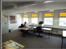
Zweigstellen in Würenlos AG + Sion VS